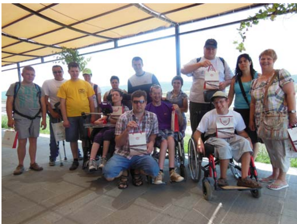
Skupinska slika pred trgovino v solinah.