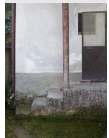
Stopnice, ki vodijo v vodo.