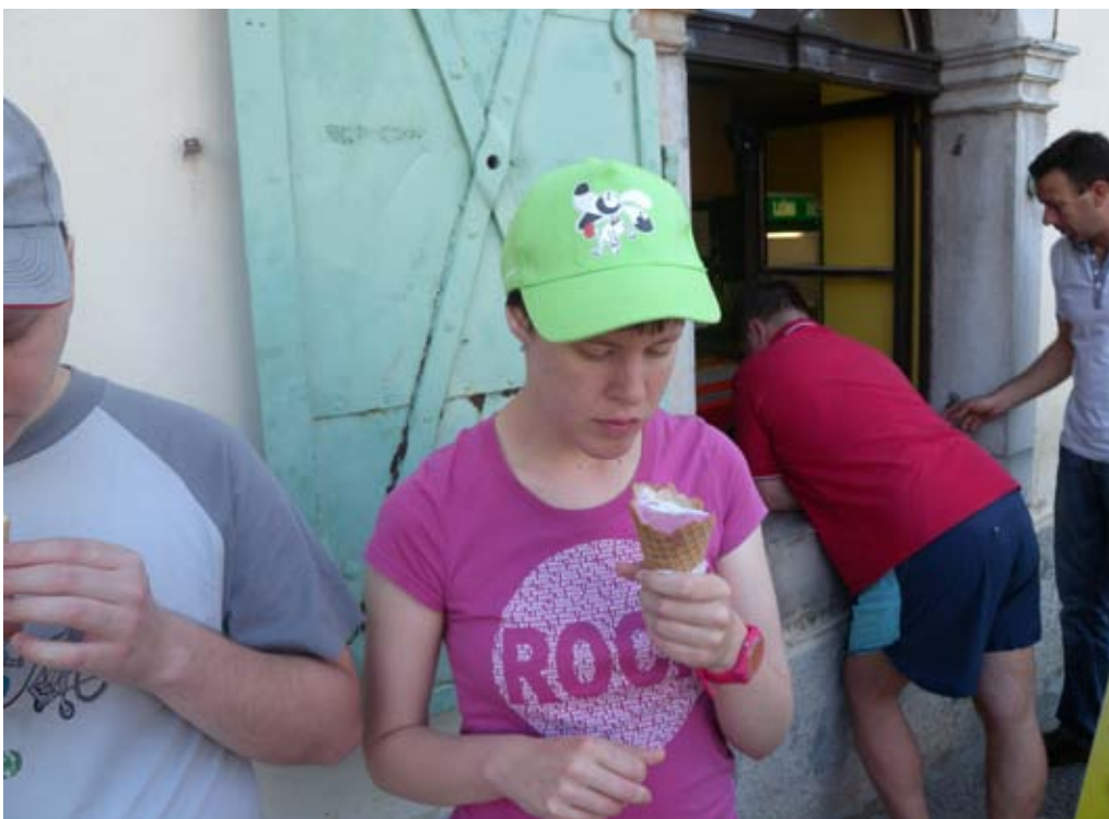
Uživanje ob sladoledu.