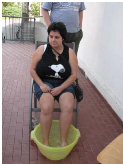
Anja si namaka noge v kopeli.