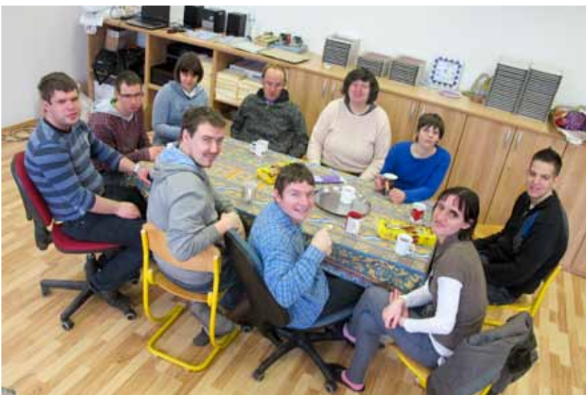
Praznovanje rojstnega dne.

Ester imamo zelo radi, ker je zelo simpatična.