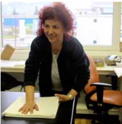
Šiviljam pomagajo tudi pridne sodelavke iz Želvinega čistilnega servisa.