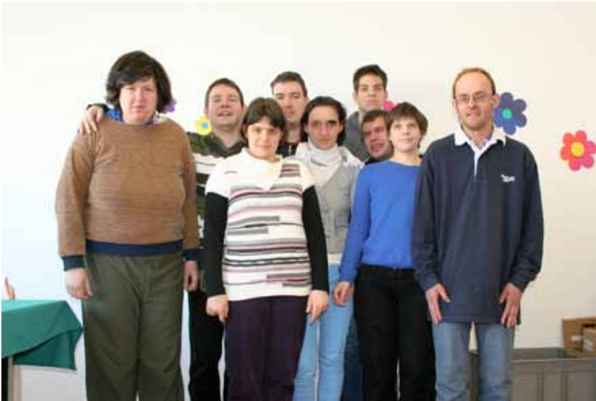
Udeleženci programa Na krilih znanja.

Na sliki smo uporabniki socialne vključitve. Fotografirali smo se v naši montažni delavnici. Fotografija je nastala v programu Na krilih znanja . Sodelovalo nas je enajst udeležencev. Program sta vodila gospodična Senka in gospod Peter. S programom smo bili zelo zadovoljni, želeli bi si še kakšen zanimiv program.